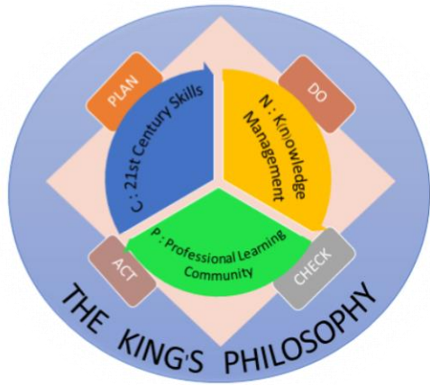
นวัตกรรม CNP Model